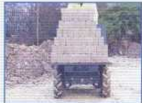
NÁKLADOVÁ PLOŠINA pro škvárobetonové bloky a pytle s cementem