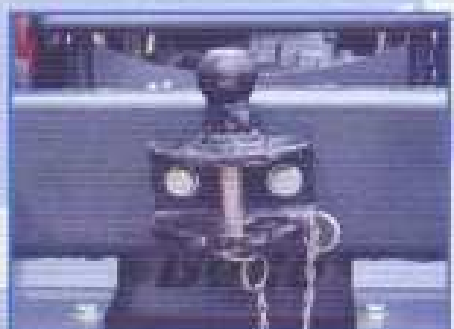
VIDITELNÉ TAŽNÉ ZAŘÍZENÍ - Těžký přívěs