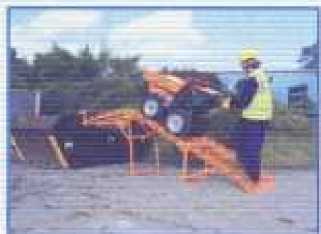
RAMPA - skládací a snadno transportovatelná