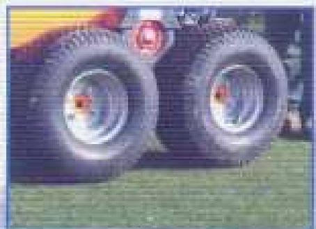
FLOTAČNÍ PNEUMATIKY - Pro měkké podlaží